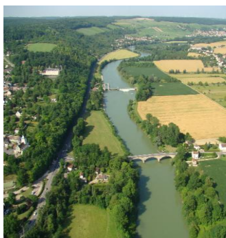
Ecluse de Méry et pont de Saacy