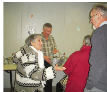
Au cours de cette petite fête, la distribution d'un panier plein de très bonnes choses.

C'est dans une ambiance conviviale que le dimanche 11 décembre, trente cinq de nos Anciens, invités par M. le Maire et les membres du CCAS, ont reçu leur colis de Noël.