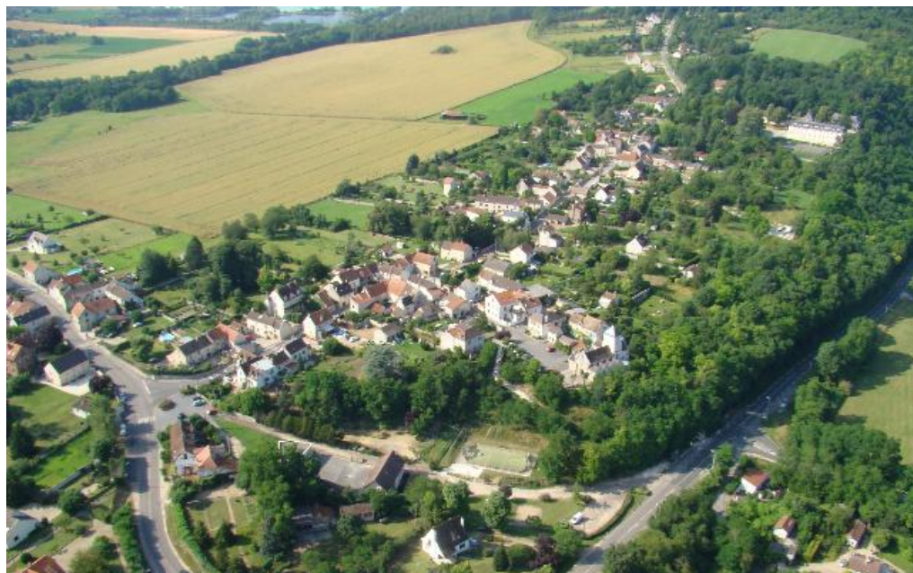
Méry vu du ciel