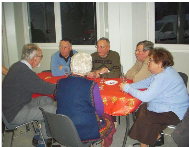
Un échange entre Monsieur le Maire et quelques uns de nos anciens.